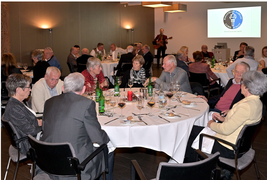
Gemütlicher Jahresend-Anlass des Panathlon Clubs Aargau im Club Lokal Golfrestaurant Aarau West.